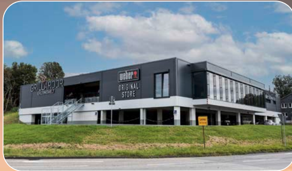
Hochbau Weber Original Store Grillardor

Als Ihr großes Bauunternehmen der Region wissen wir genau, worauf es Ihnen ankommt: Wirtschaftlichkeit, Termintreue und genaues Kostenmanagement. Darauf verlassen sich unsere Business-Kunden seit über 125 Jahren.